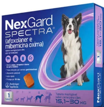
ANTIPULGAS NEXGARD SPECTRA 15,1 A 30KG 1 TABLETE