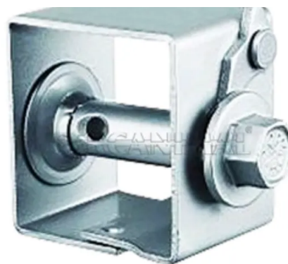
Catraca para esticar arame liso

R$ 69,31 à vista com desconto Transferência ou Depósito Bancário ou