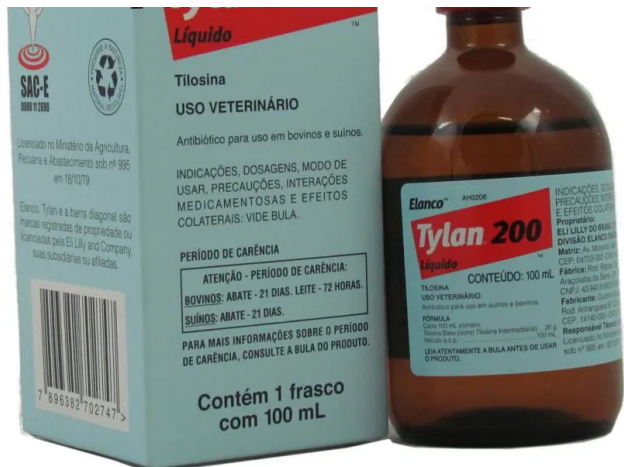
Tylan 200 Injetável - 50ml e 100ml