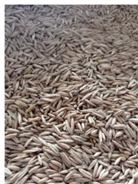
AVEIA EQUINO INTEIRA 30KG